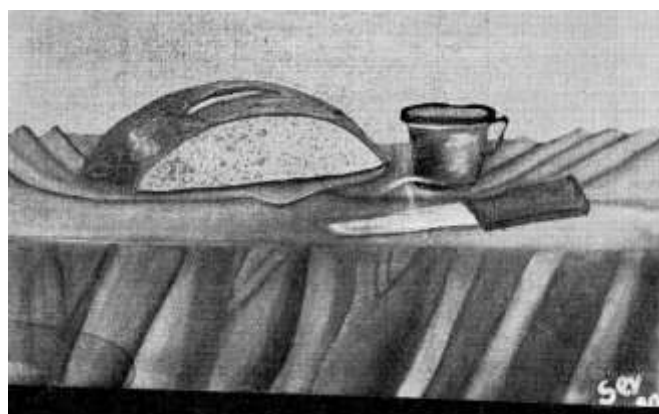
Črno-bele reprodukcije iz pesniške zbirke Rožnata kepa (1982)